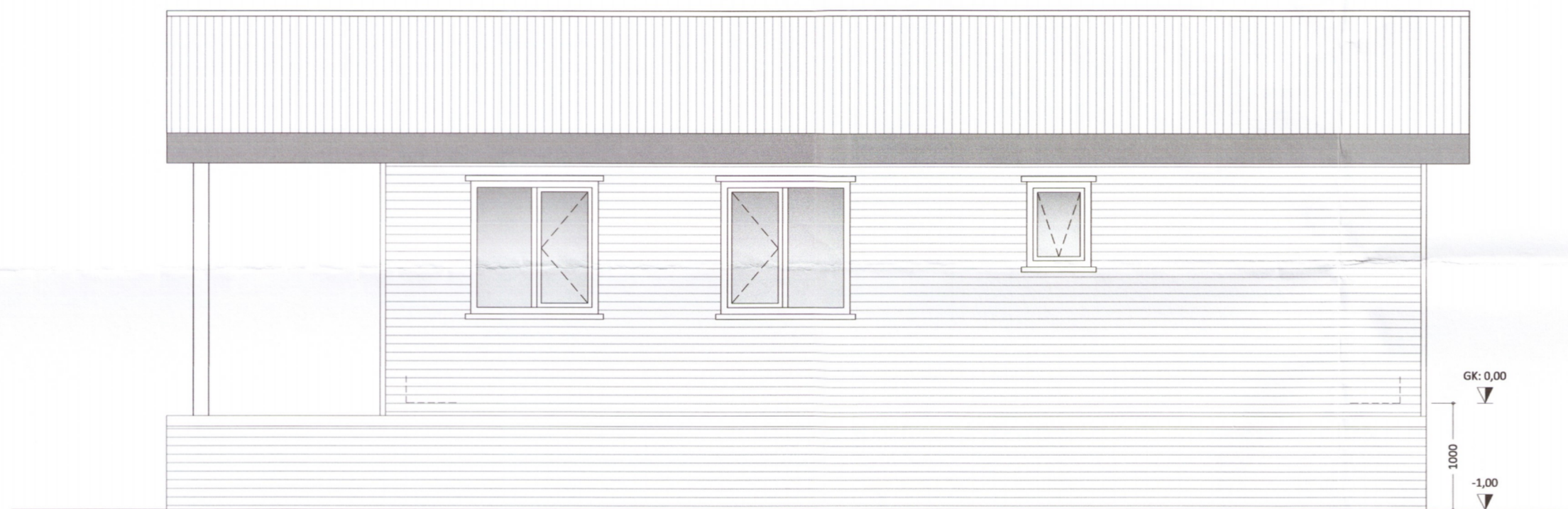
HLIÐ - 3