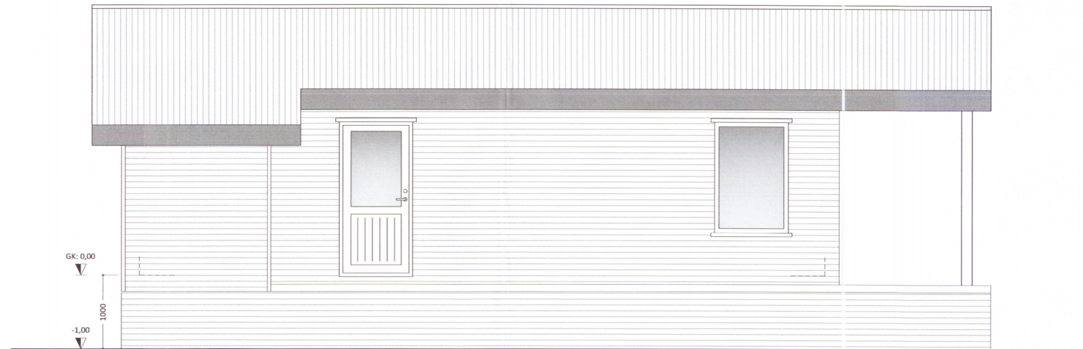
HLIÐ - 1

Umhverfis- og tæknisvið Uppsveita Samþykkt 21. nóv. 2018 Guðni Pálsson Byggingarfulltrúi