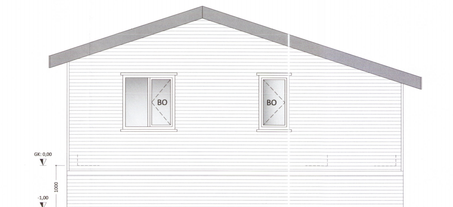
HLIÐ - 4