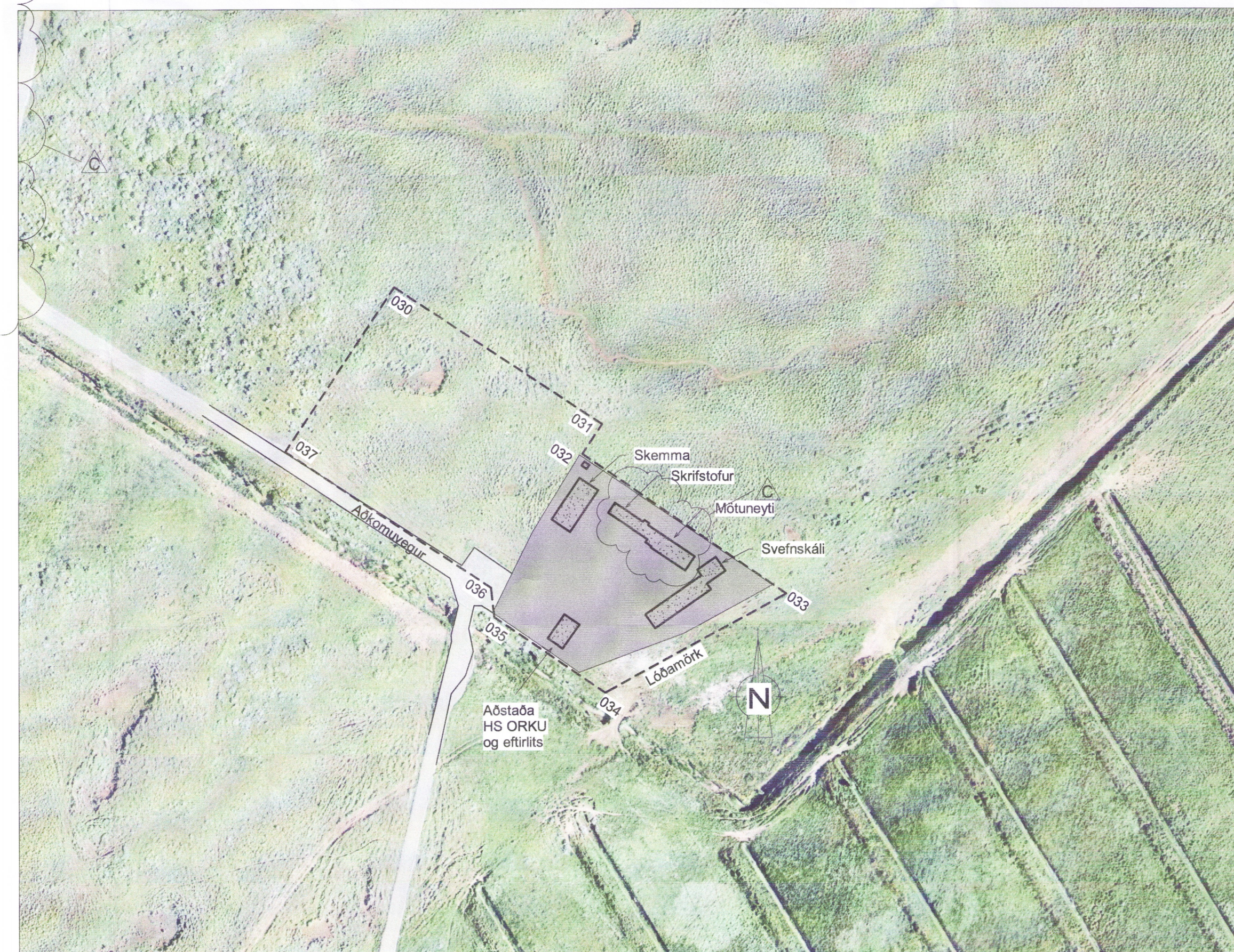
Afstöðumynd 1 : 2000