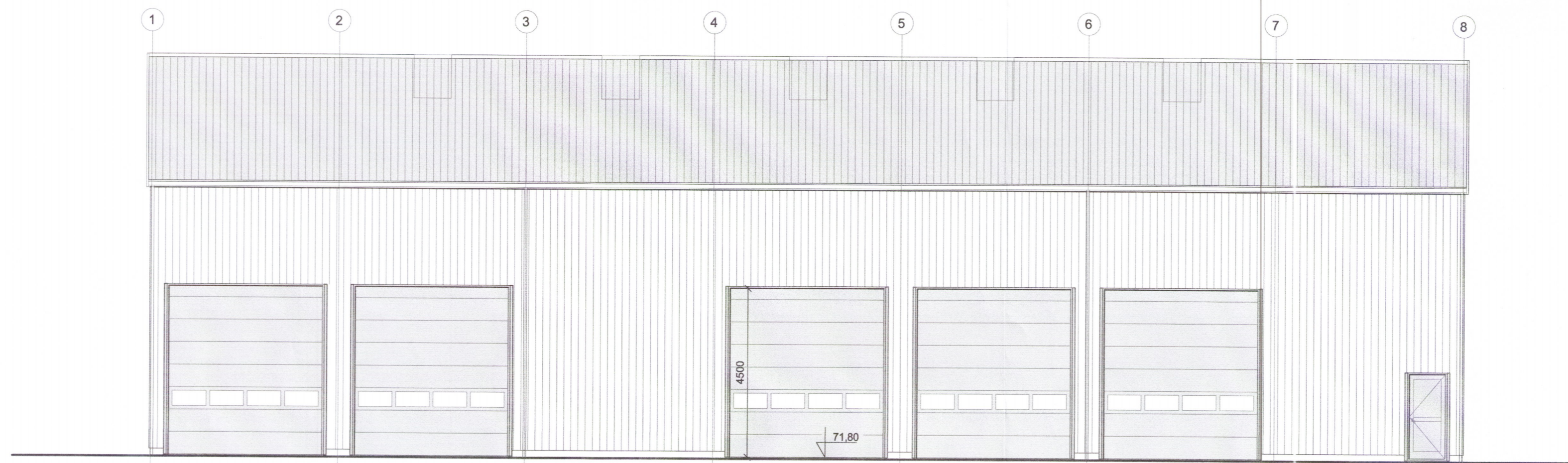
Suðaustur hlið M 1:100

ÚTG. DAGS. ÚTGÁFUFERILL HANNAÐ TEIKN. YFIRF. B1 04.09.'19 Breytingar á hurðum SSI GH