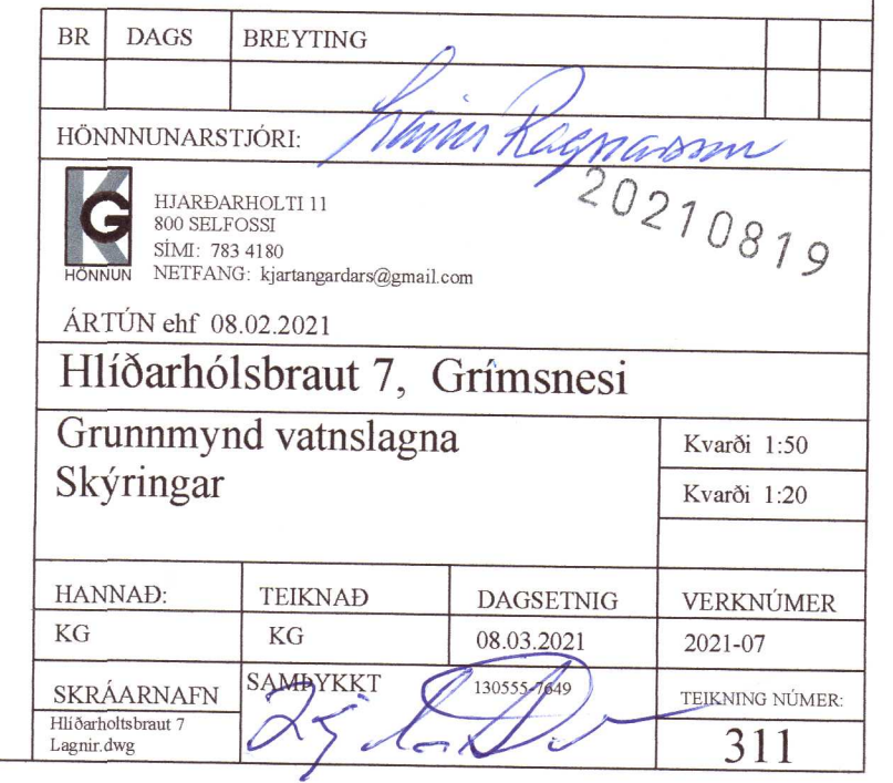
Grunnmynd neysluvatnslagna MKV: 1:50