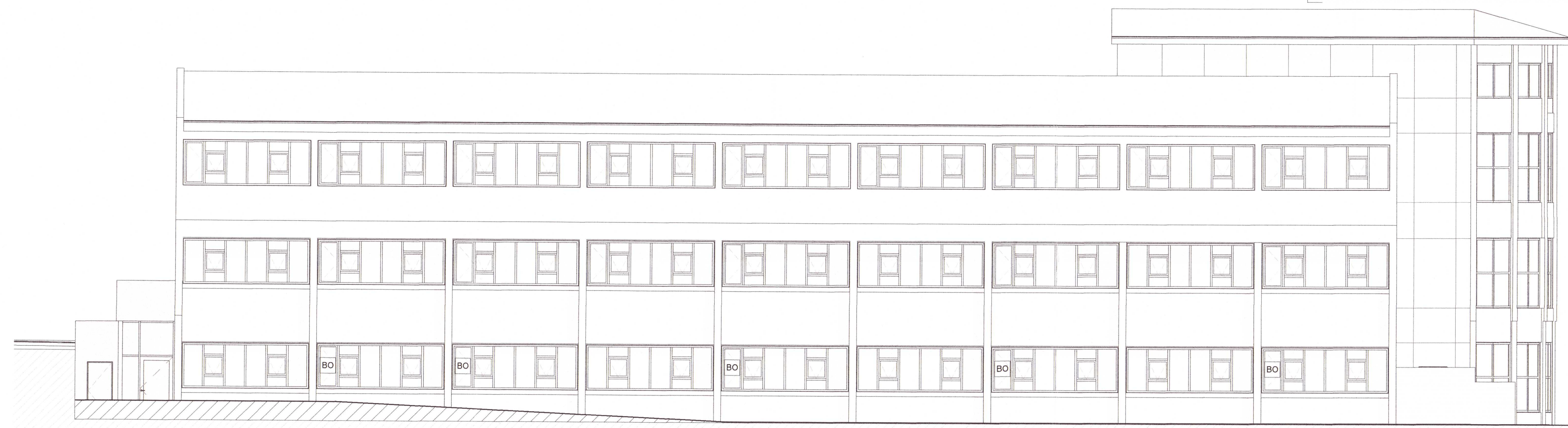
2 Ásýnd Vestur 1:100