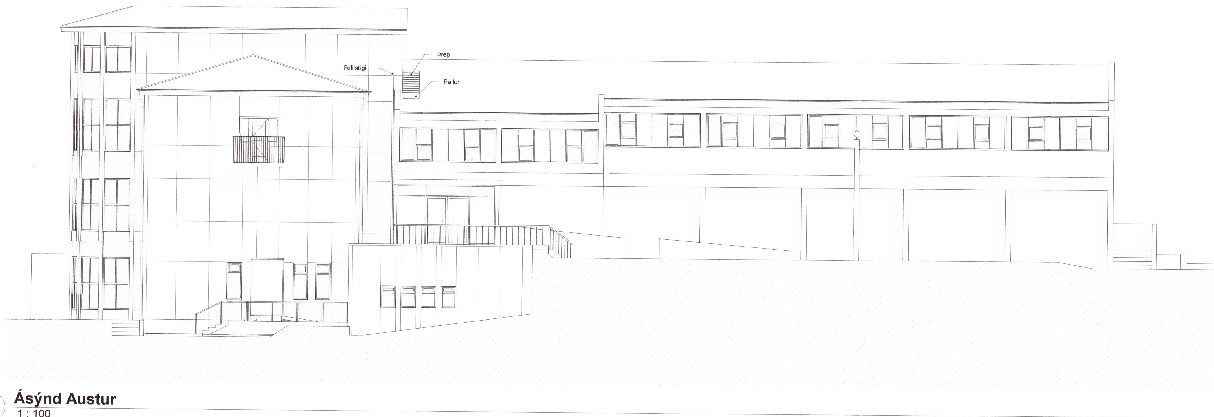
1 Ásýnd Austur 1:100