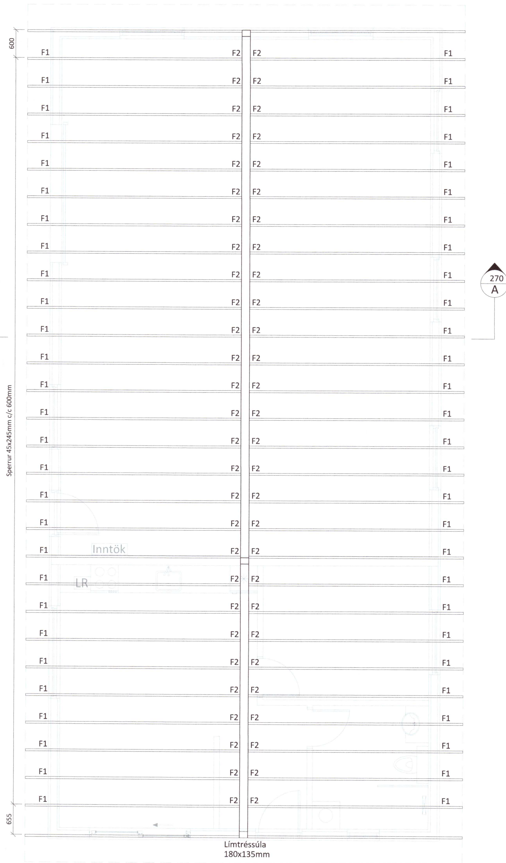
Grunnmynd Sperrur Mkv. 1:50

LARSEN HÖNNUN OG RÁÐGJÖF Bent Larsen Fróðason Byggingaráfræðingur B.Sc Sími 844-7699 tölvupóstur: bent@larsenhr.is VERKNR: 21-146 MKV: 1:50