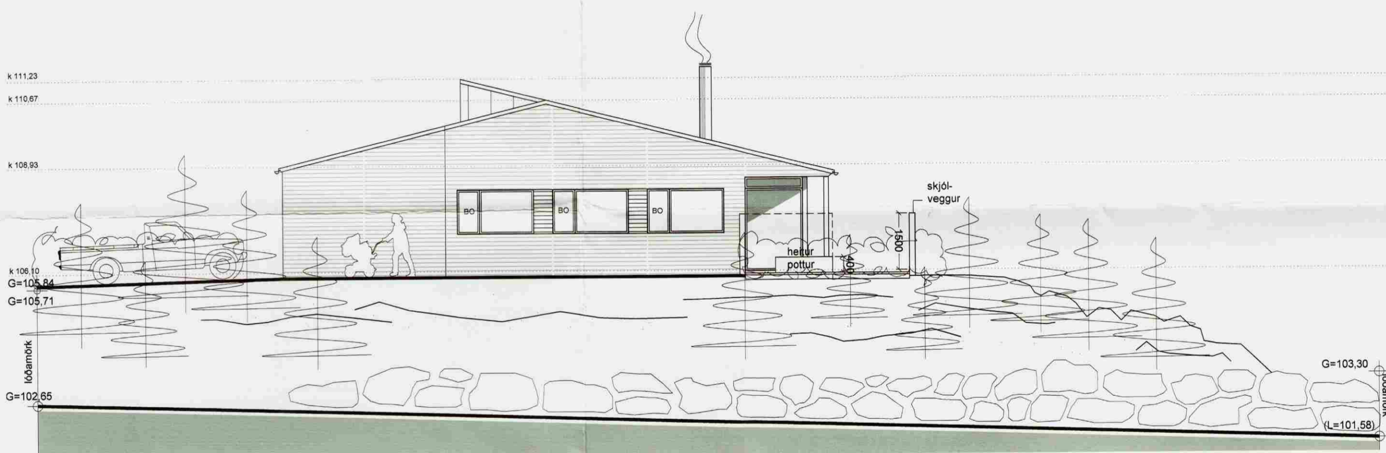
ÚTLIT VESTUR M 1:100