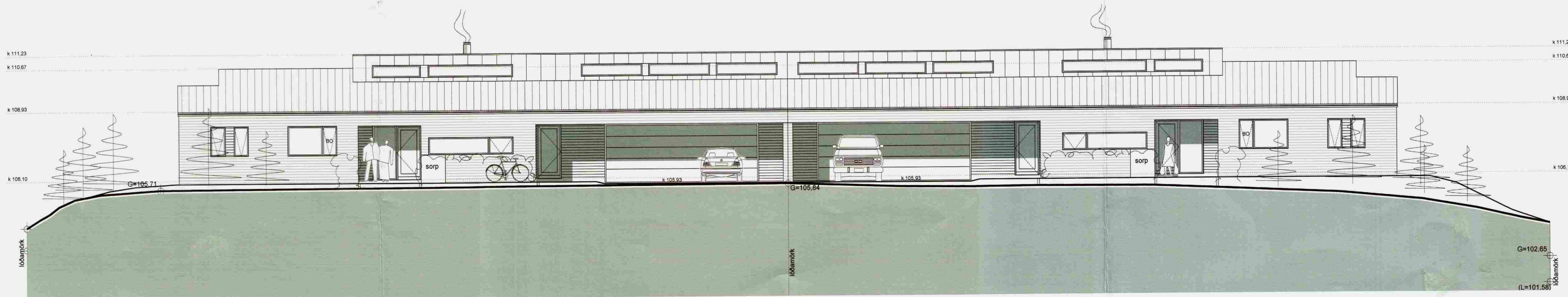
ÚTLIT NORÐUR M 1:100