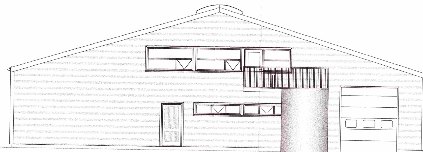
ÚTLIT TIL NORÐURS