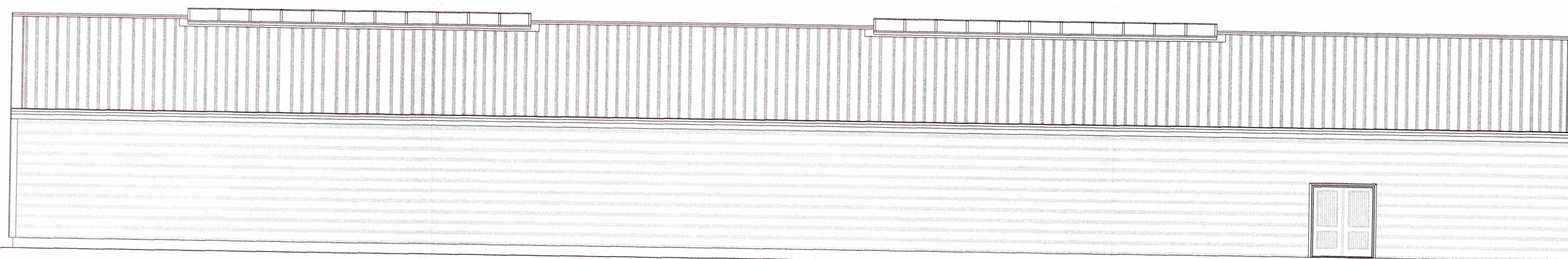
ÚTLIT TIL AUSTURS

07.01.2008 Milligöf stakkað og þakluggum breytt