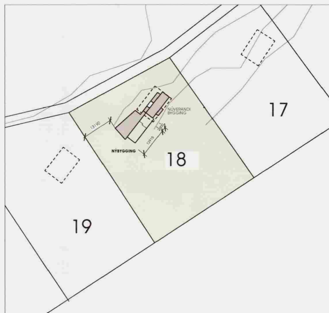
AFSTÖÐUMYND mkv. 1:1000

Samþykkt 11 JUL 2006 Núlp Guð Byggingarfulltrúi uppsveita Árnessýslu