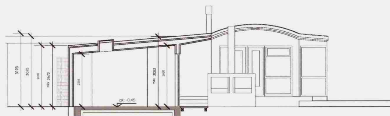
SNEIDING C-C mkv. 1:100