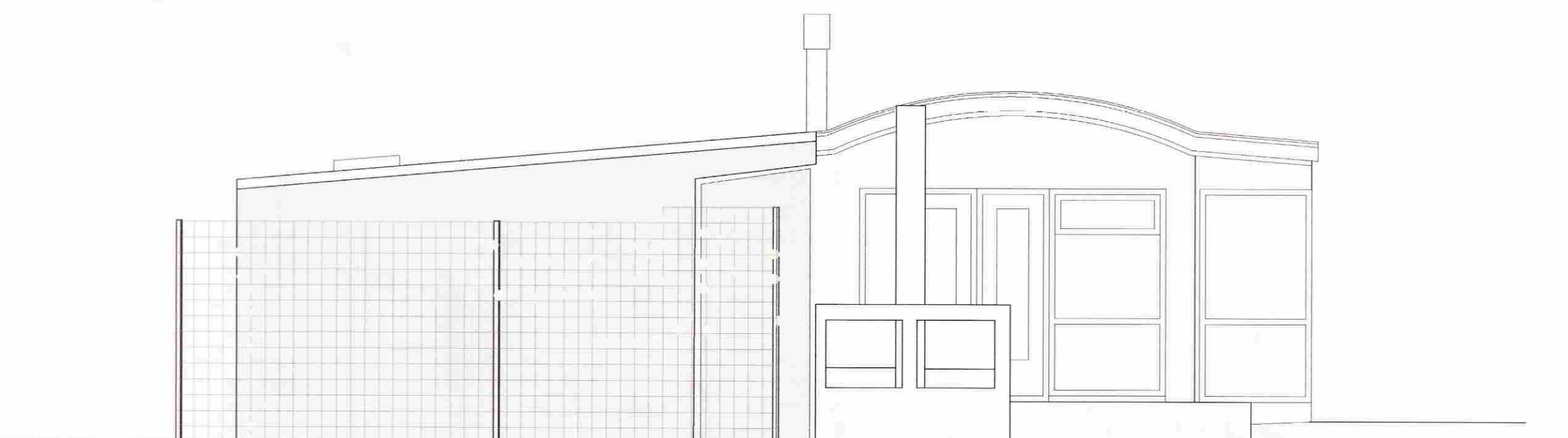
ÚTLIT TIL SUÐ-VESTURS mkv. 1:50