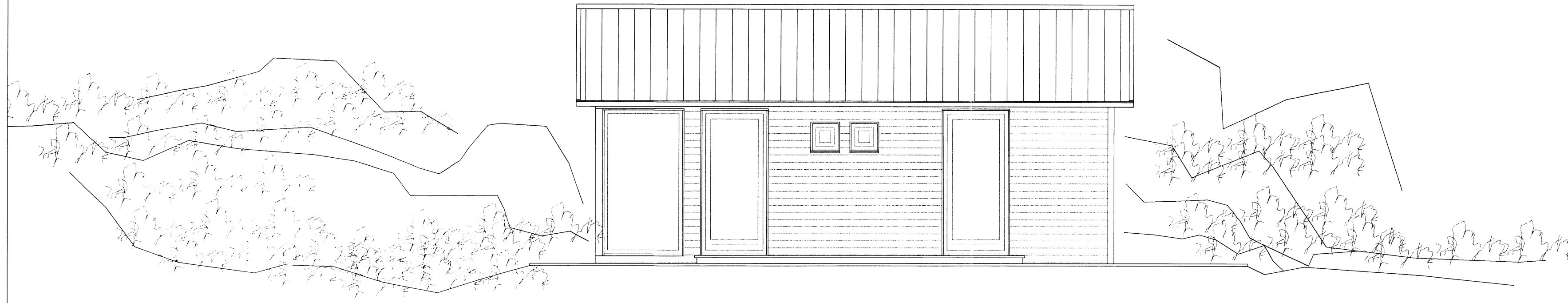
ÚTLIT NORÐ-AUSTUR, MKV. 1:50.

Skipulags- og byggingarfulltrúi vippaveita bs. Samþykkt 4 - SEPT. 2014 Ragnýr Þ. Þorvörð Byggingarfulltrúi