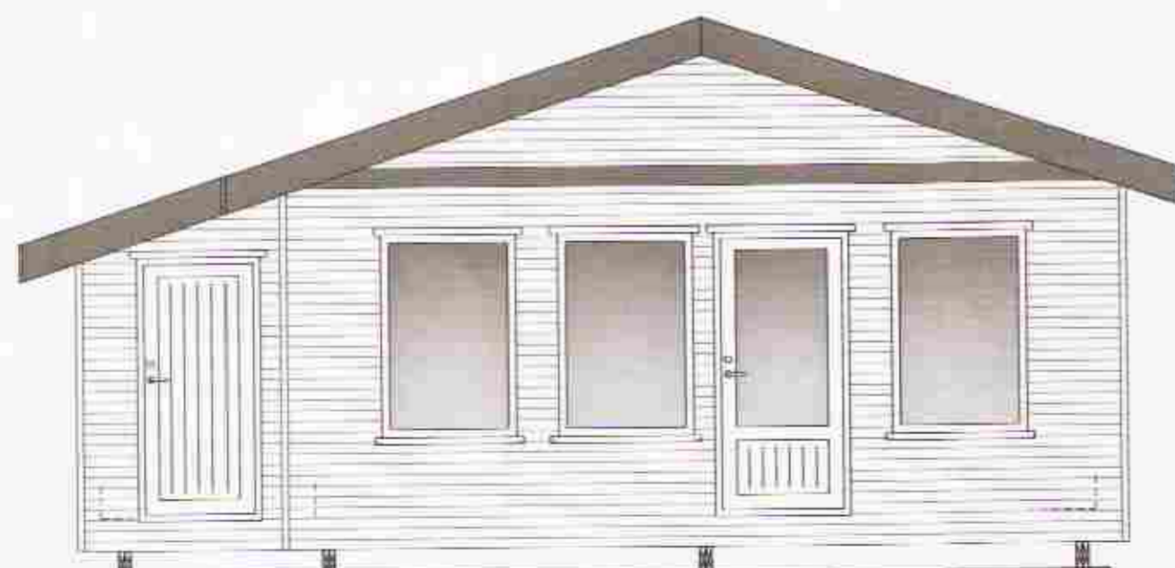
HLID - 2