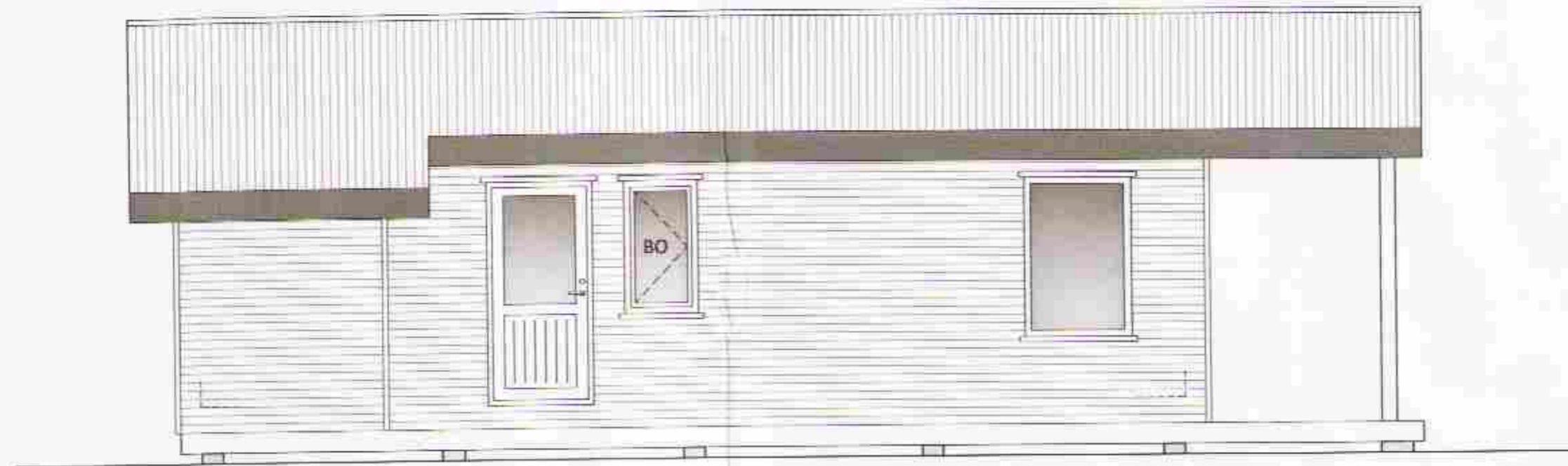
HLID - 1