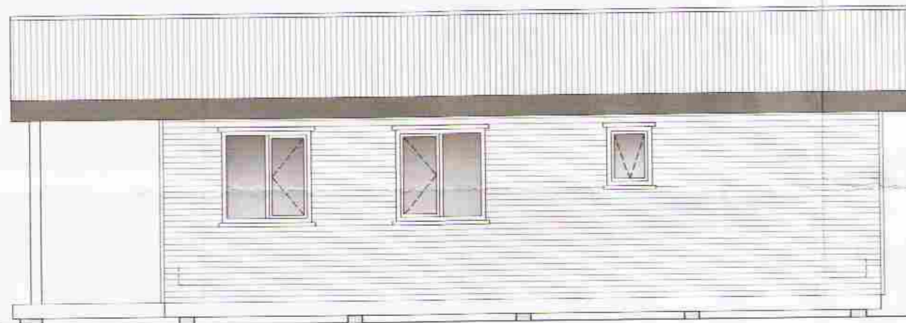
HLID - 3