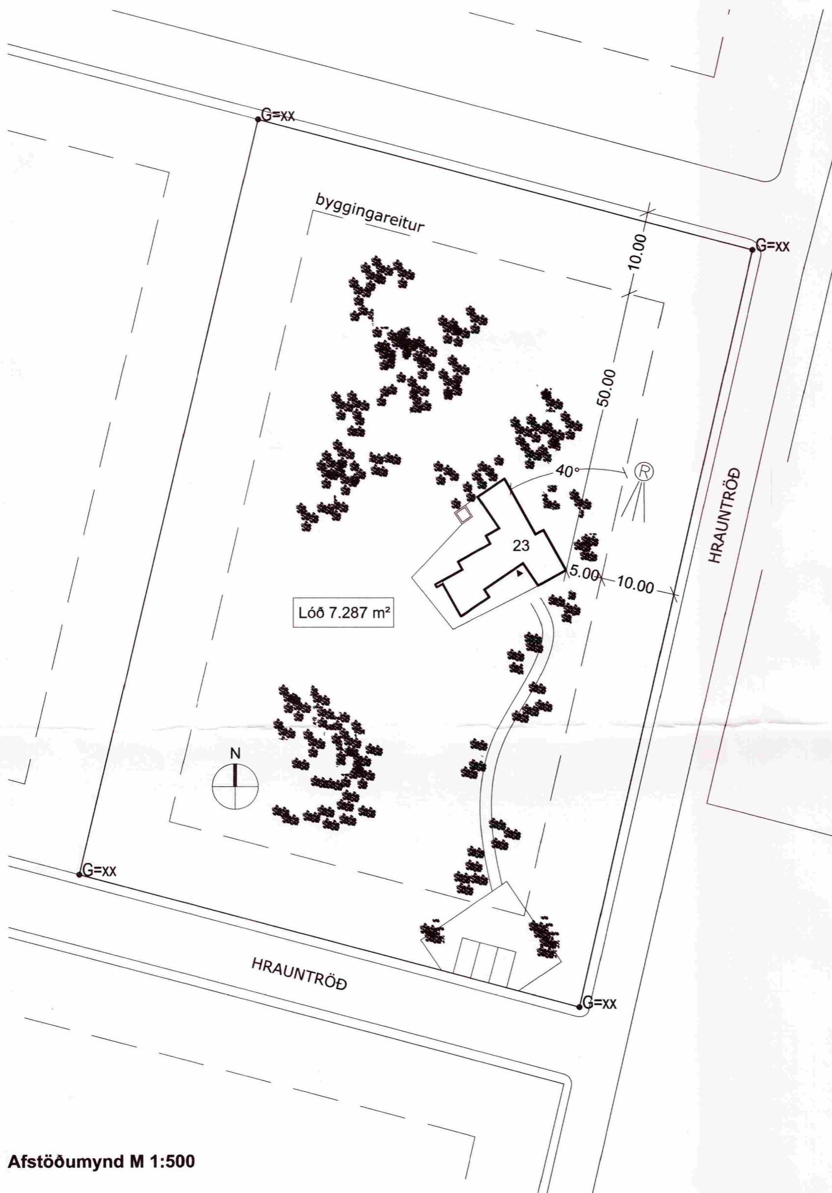
Afstöðumynd M 1:500