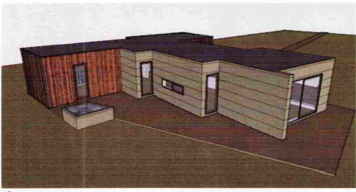
Ásýnd frá vestri