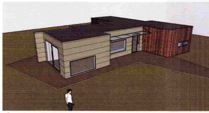
Ásýnd frá suðri