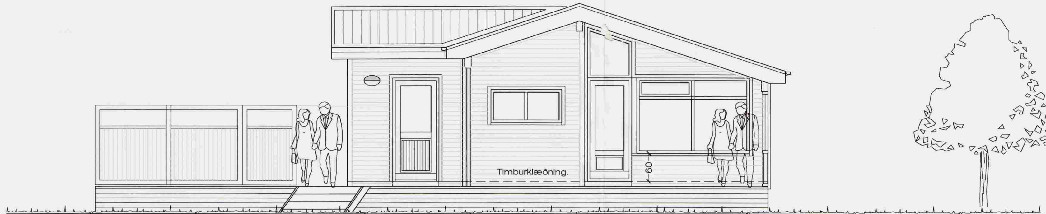
Suð - vesturhlíð. 1 : 50

Samþykkt 29 APR. 2008 Helgi Kjartan Byggingarfulltrúi uppsveita Árnessýslu