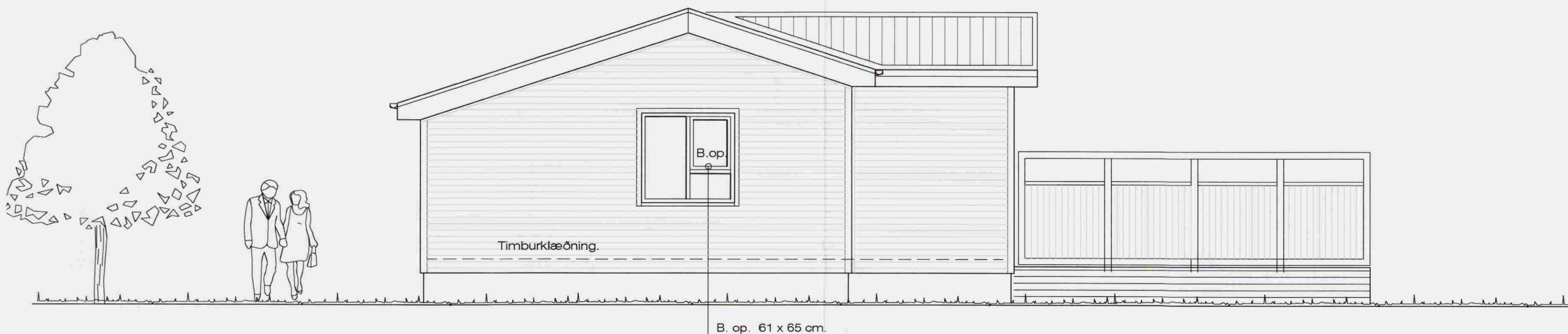
Norð - austurhlíð. 1 : 50

Kjarrengrí 3, í landi Miðengis. Útlit. VERK. NR. 04 DAGS. 19.-3.-2008 MÁL. 1:50 TEIKN. NR. 04 BREYTT. JÓN GUÐMUNDSSON ARKITEKT Jón Guðmundsson VINNUSTOFA SUÐURLANDSBRAUT 16 REYKJAVÍK SÍMI 552 5055