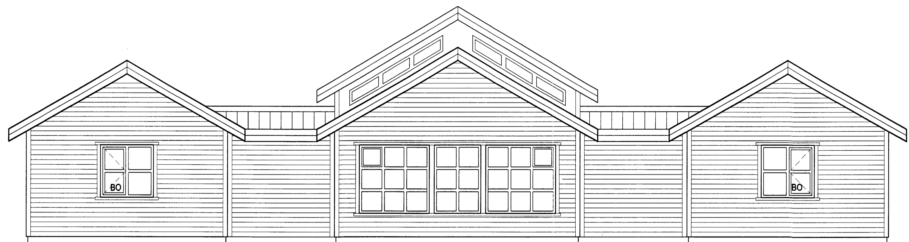
ÚTLIT VESTLÆG HLIÐ