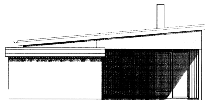
VESTUR snid 1:100