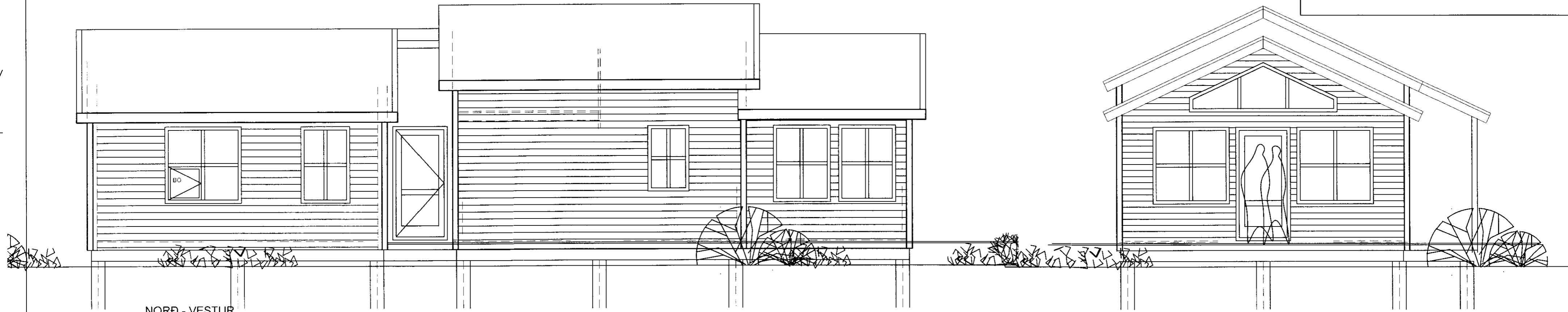
NORÐ - VESTUR

SAMDYKKT 02. DES. 2009 Alm. Kjartan Bygginguvaldið upplýsingar, Amessýsla og Flóahúsið