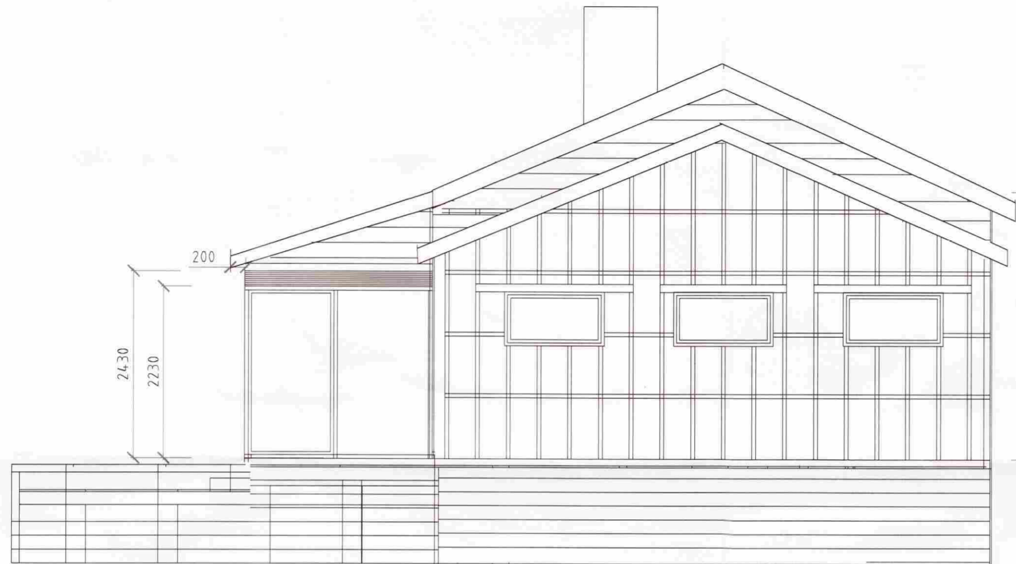
austur snið í viðbót A-A