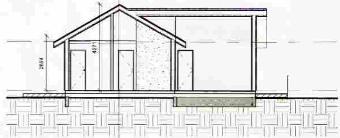
2 Snið 1 1 : 100