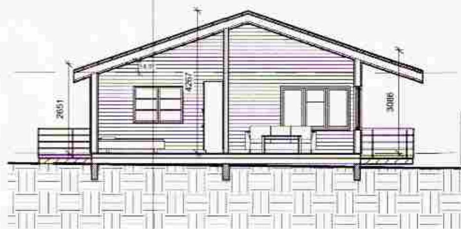
3 Snið 2 1 : 100