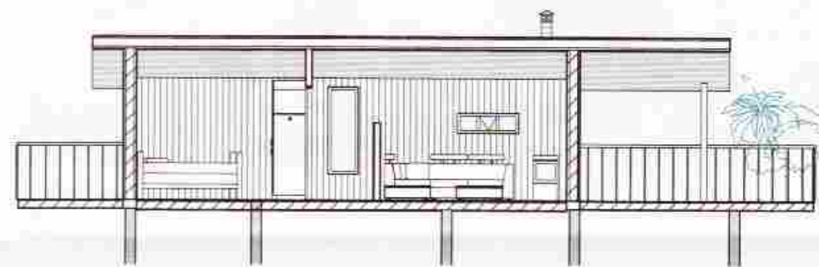
4 Snið 2 1 : 100