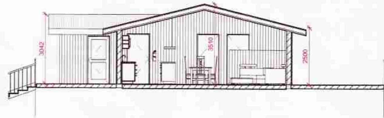
5 Snið 1 1 : 100