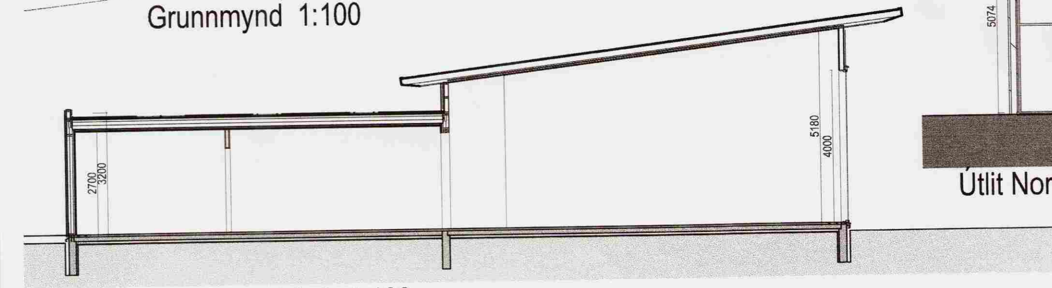
Skurðmynd A-A 1:100