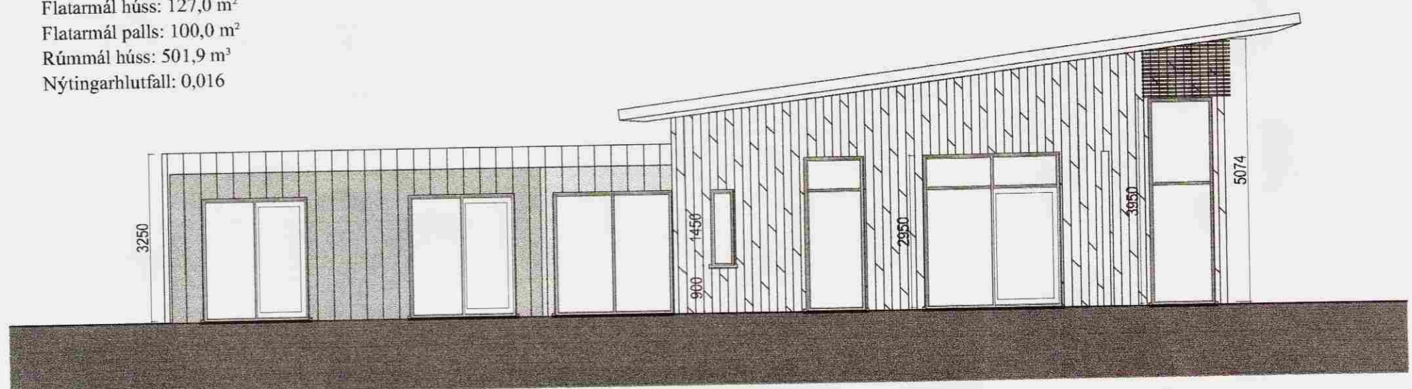
Útlit Suður 1:100

Sambýkkt 18 MARS 2008 Gunnar Bergmann Byggingarfulltrúi Uppsveita Ámessyslu