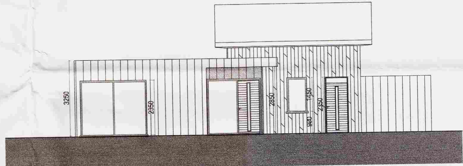
Útlit Vestur 1:100