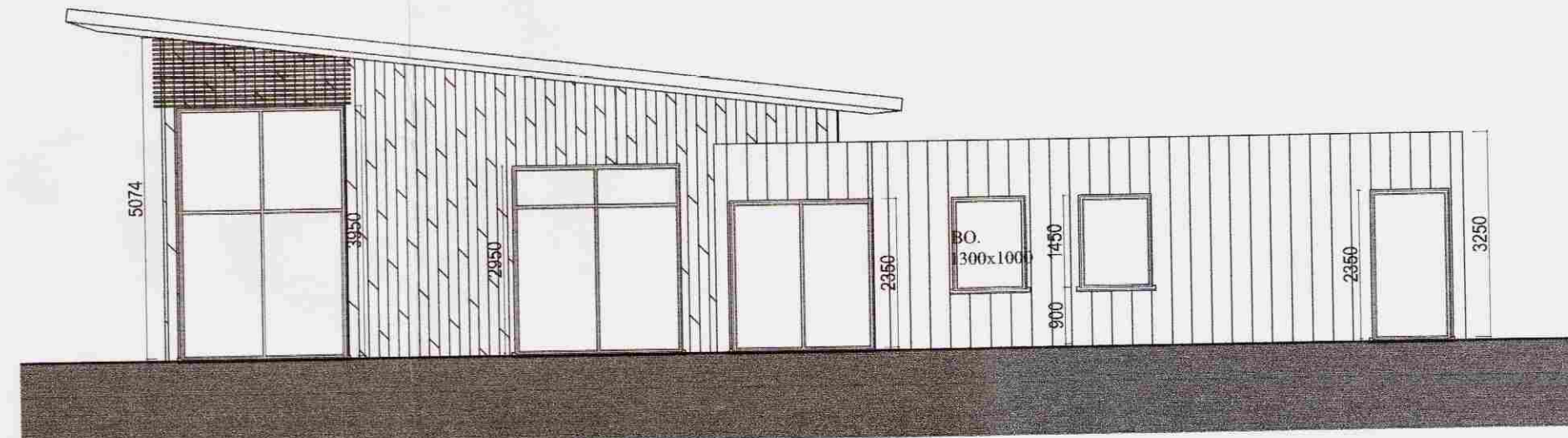
Útlit Norður 1:100