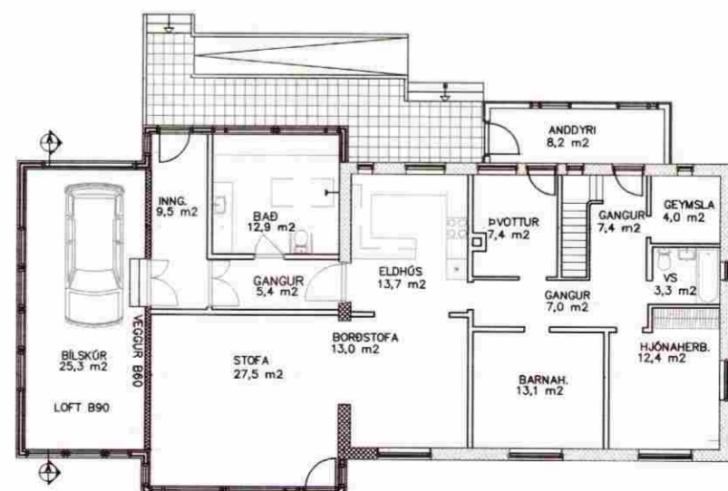
1. HÆÐ, GRUNNMYND 1:200