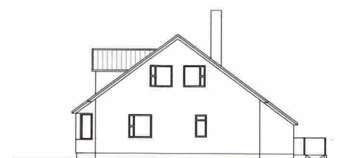
AUSTLÆG HLÍÐ 1:200