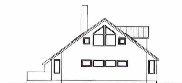
VESTLÆG HLÍÐ 1:200