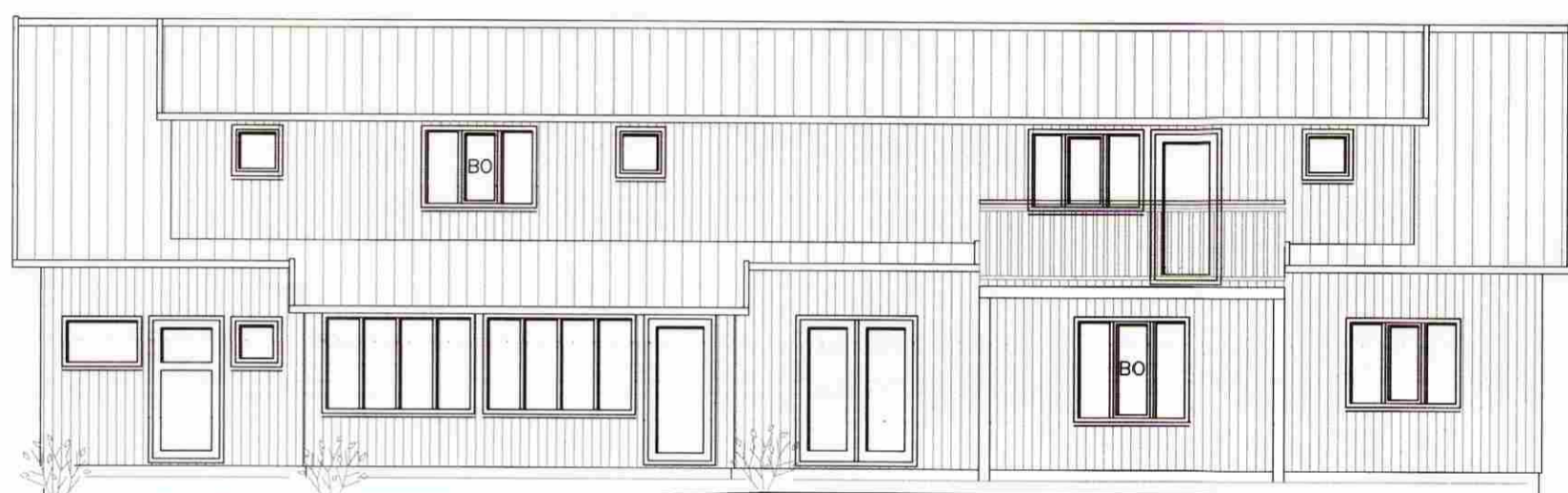
SUÐLÆG HLÍÐ 1:100