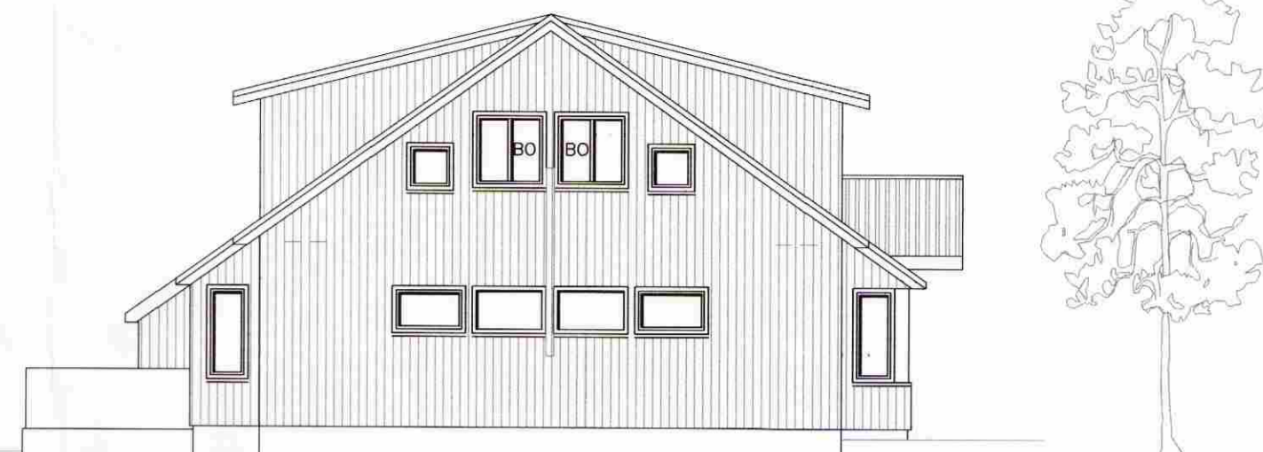
VESTLÆG HLÍÐ 1:100