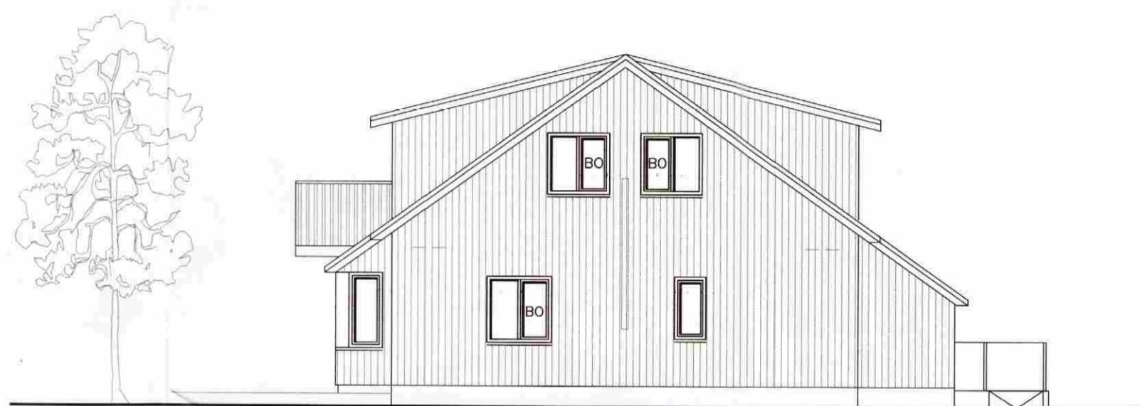
AUSTLÆG HLÍÐ 1:100