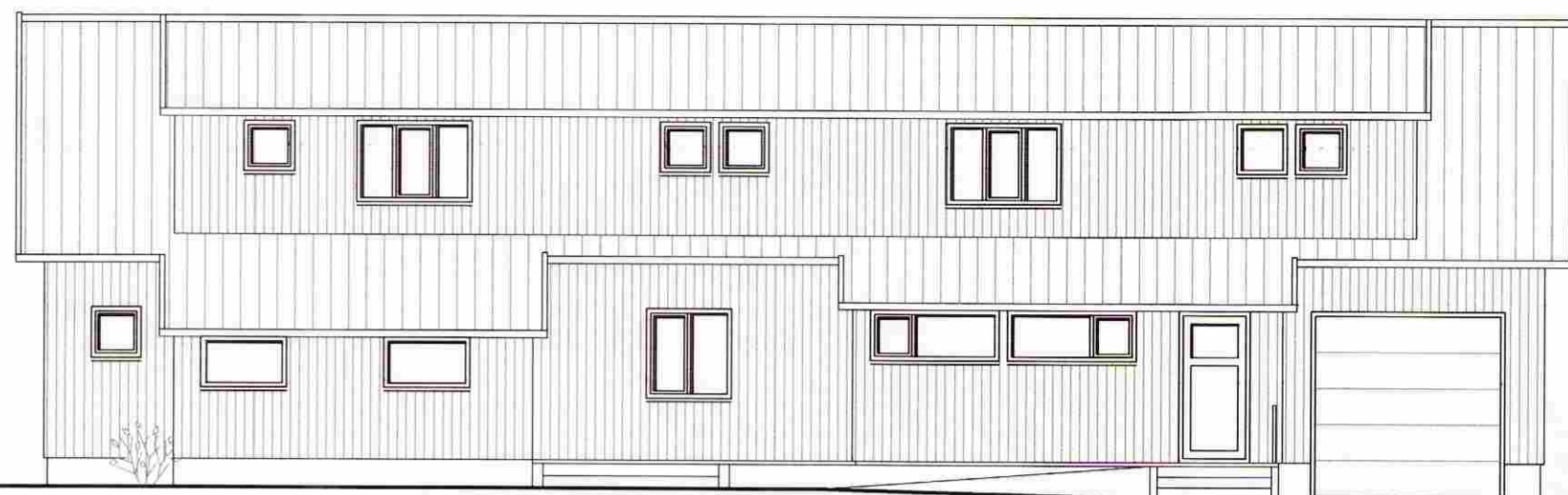
NORÐLÆG HLÍÐ 1:100

Helgi Hjálmarsson Byggingarhlutriti uppsv. Árnæssyslu og Flóahár.