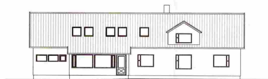
SUÐLÆG HLÍÐ 1:200