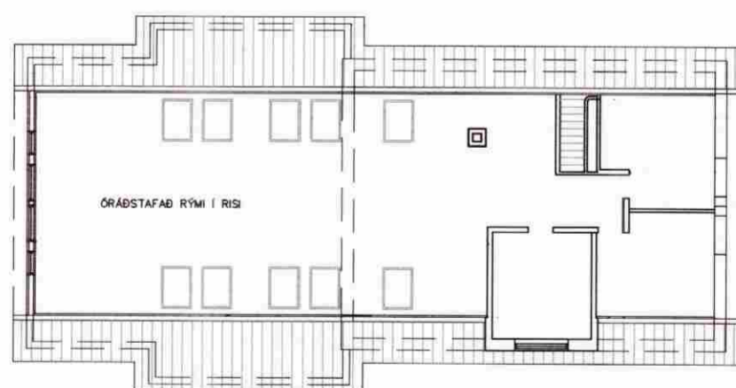
RISHÆÐ, GRUNNMYND 1:200