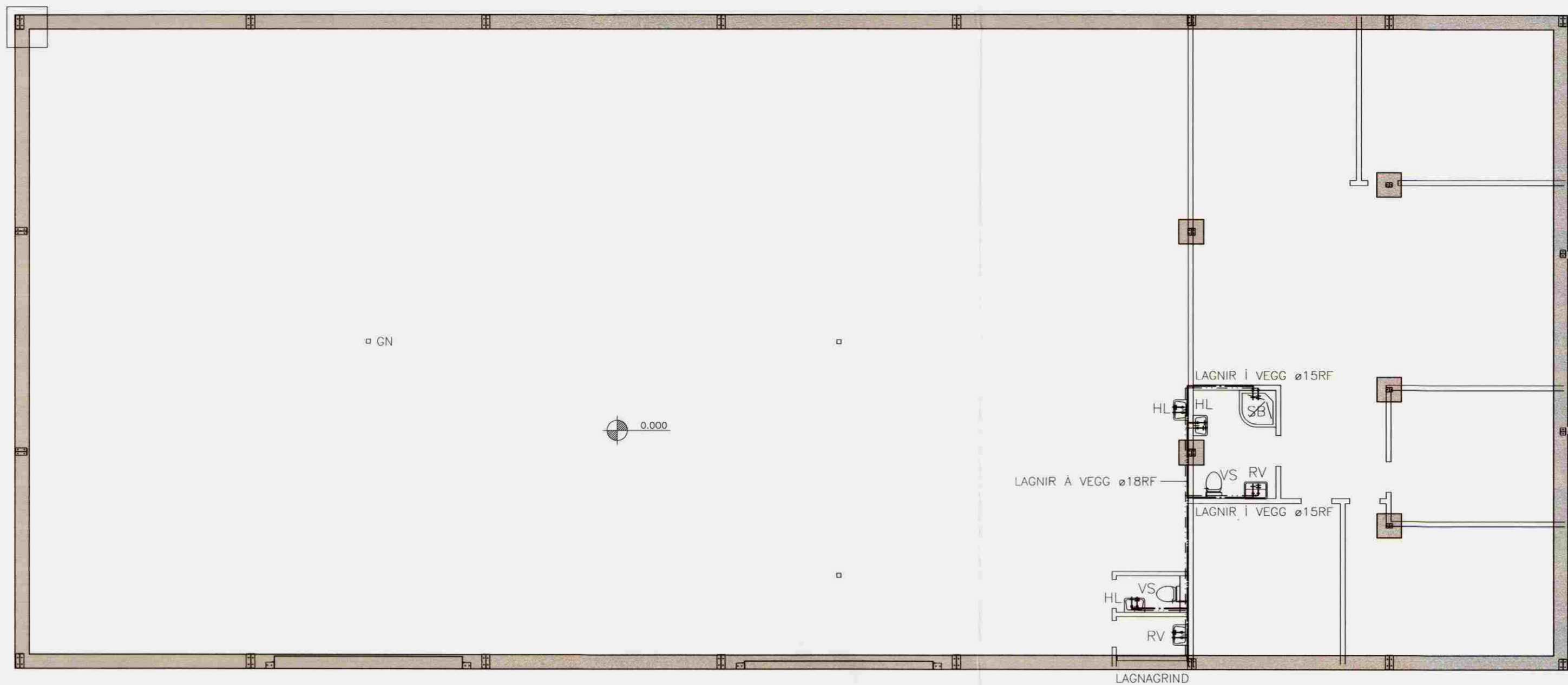
GRUNNMYND NEYSLUVATNSLAGNA 1. HÆÐ Mkv. 1:100