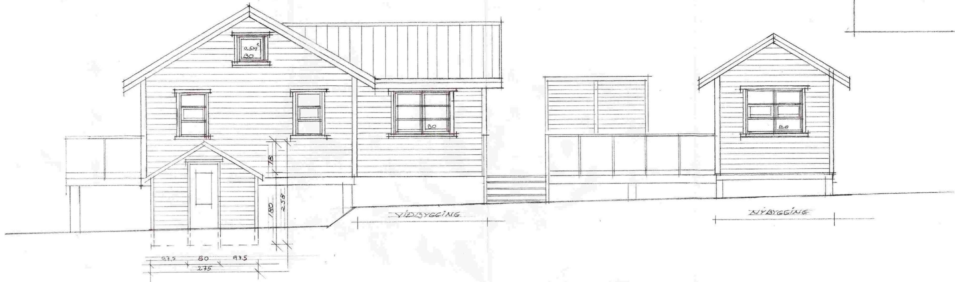
ÚTLIT NORÐUR M = 1:50

SAMÞYKKT 15 APR. 2009 Ólafur Kjartan Byggingafróðfræðingur, Amessýslu og Floah.