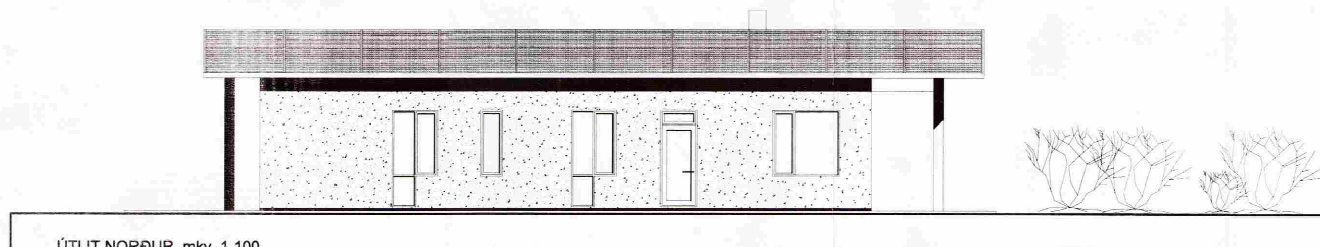
ÚTLIT NORÐUR mkv. 1.100