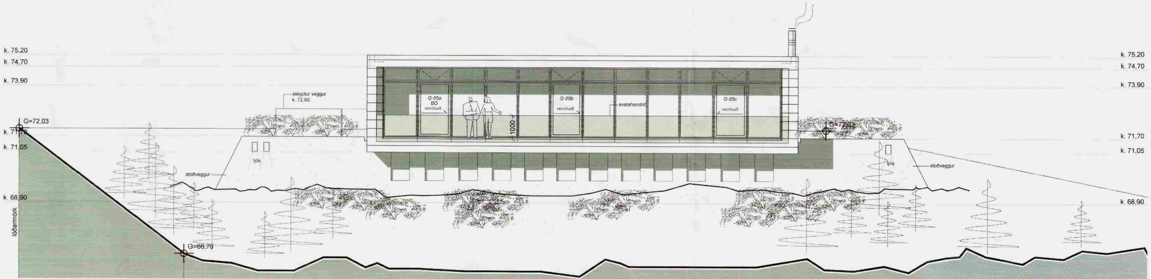
ÚTLIT SUÐAUSTUR M 1 : 100