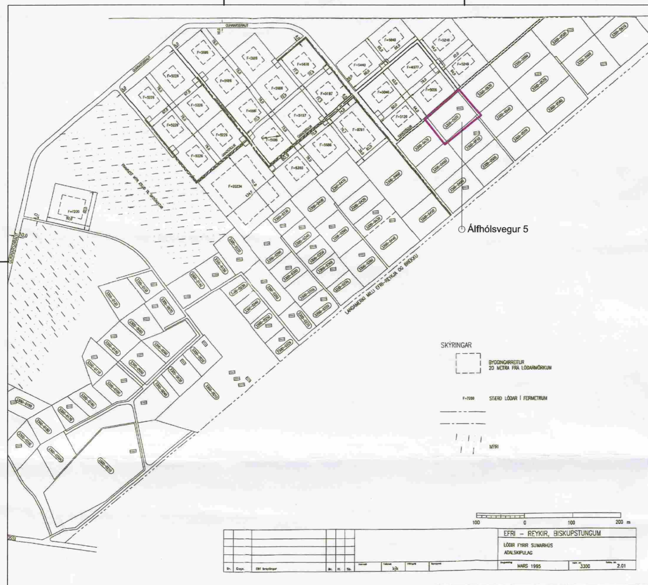
Afstöðumynd m. 1:5000 Skannað aðalskipulag Efri Reykja dags. mars. 1995