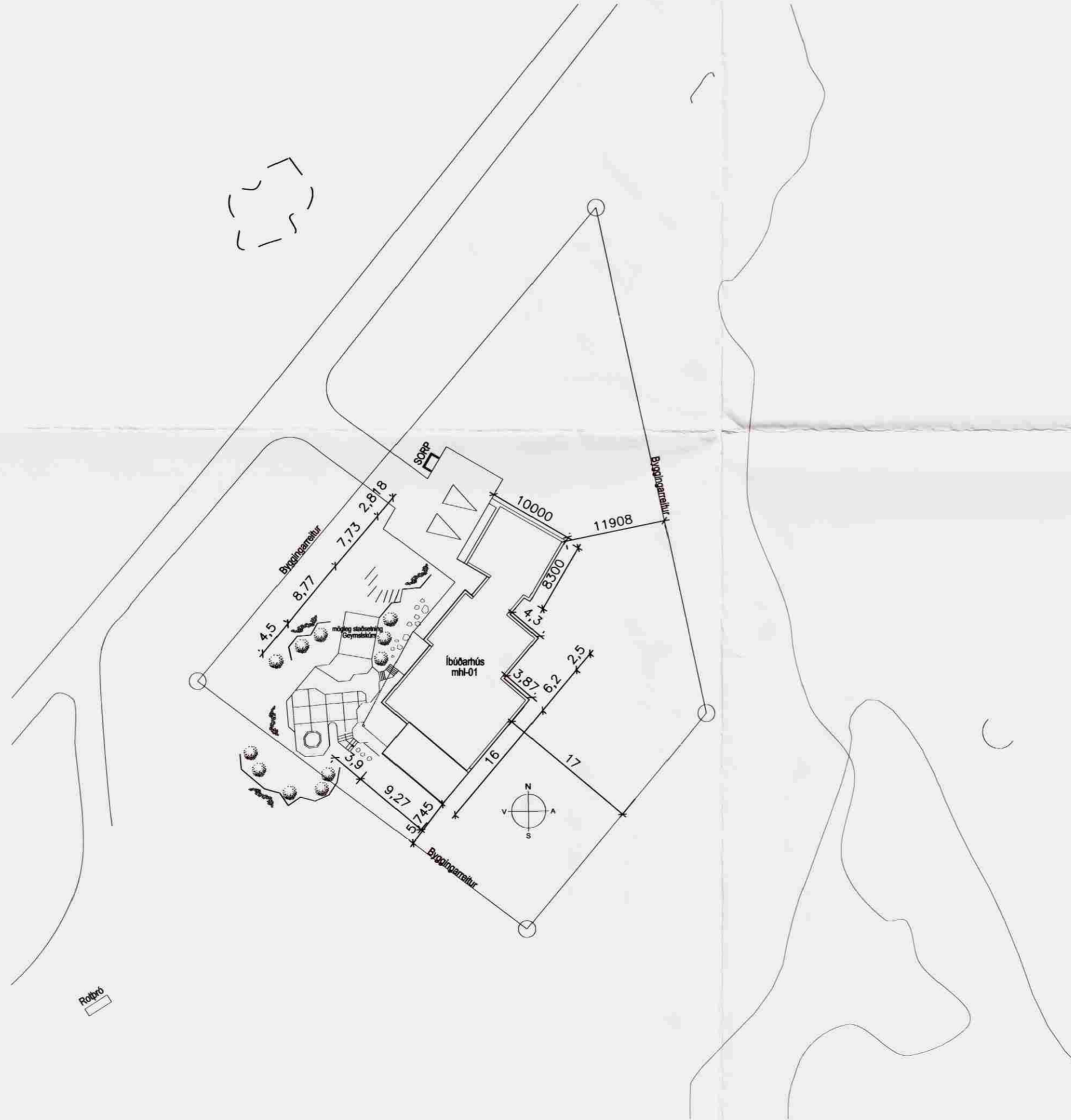
AFSTADA Mkv. 1:500