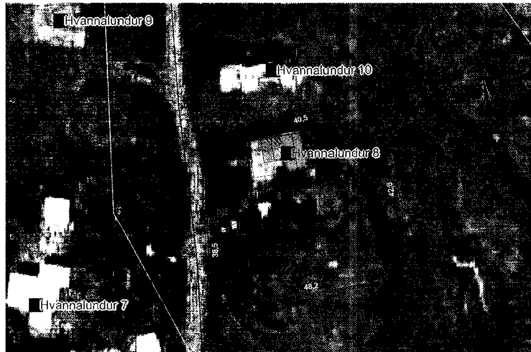
Afstöðumynd, mkv. 1:500