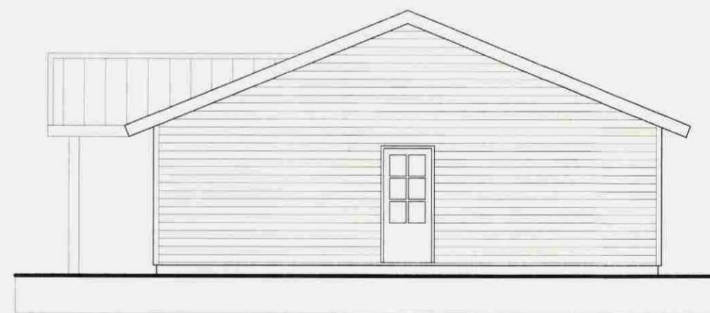
ÚTLIT AUSTUR 1:50