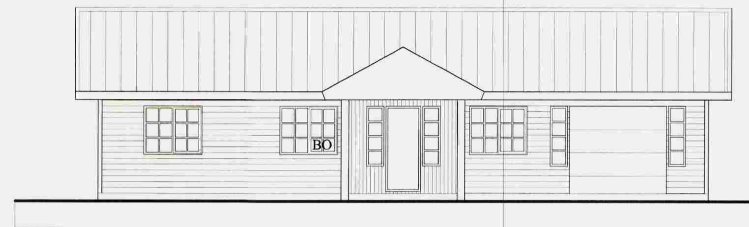
ÚTLIT SUÐUR 1:100