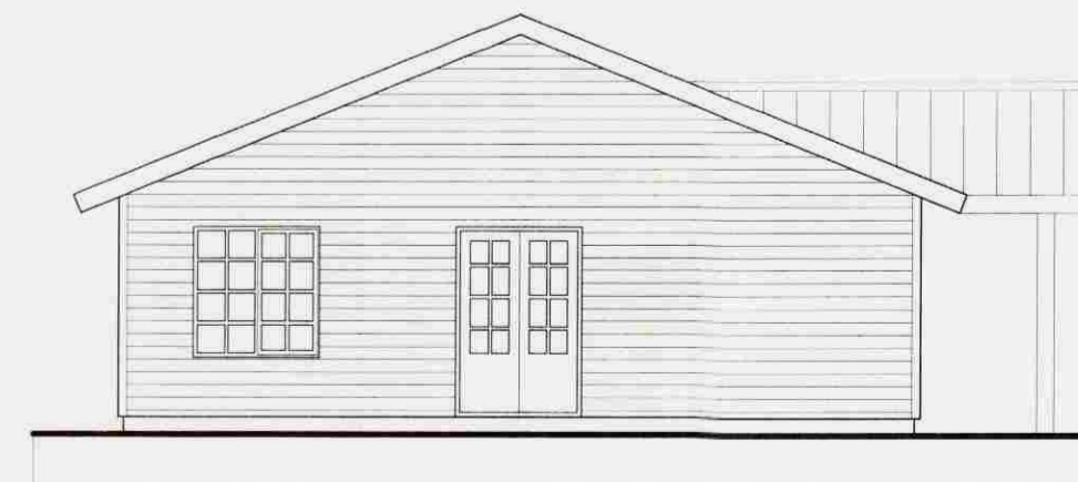
ÚTLIT VESTUR 1:50

Samþykkt 24 JUNI 2008 Alpi Guðsen Byggingarfulltrúi uppsveita Ámessýslu