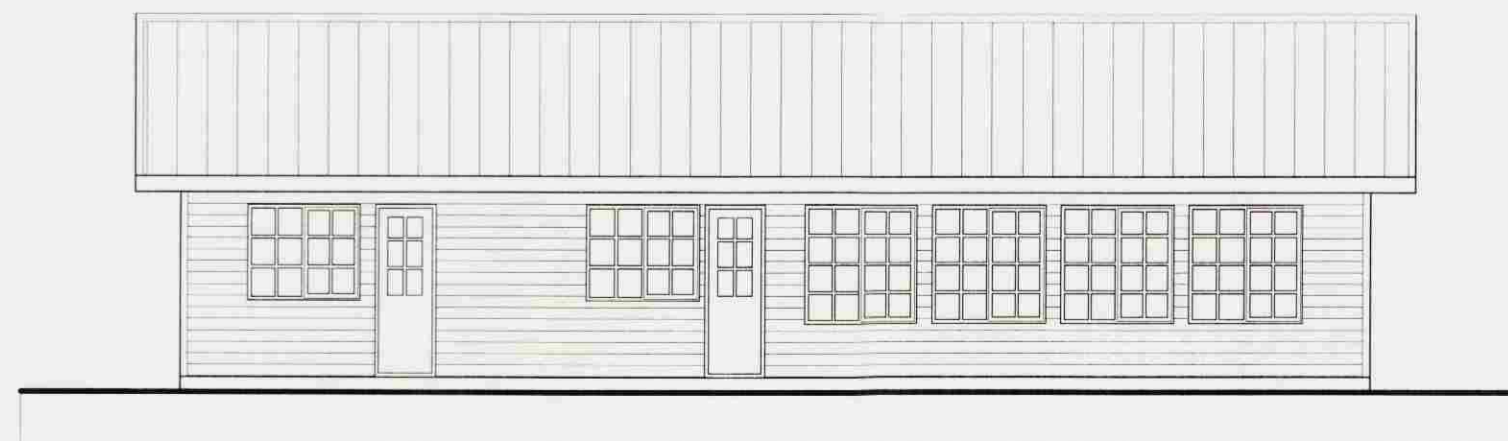
ÚTLIT NORÐUR 1:100