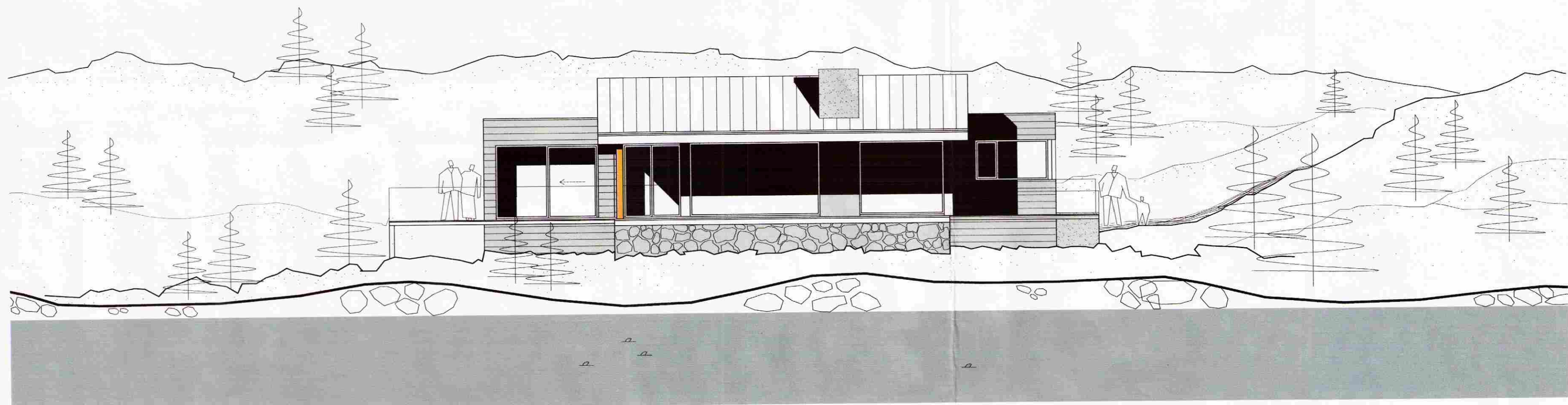
ÚTLIT SUÐAUSTUR M 1:100