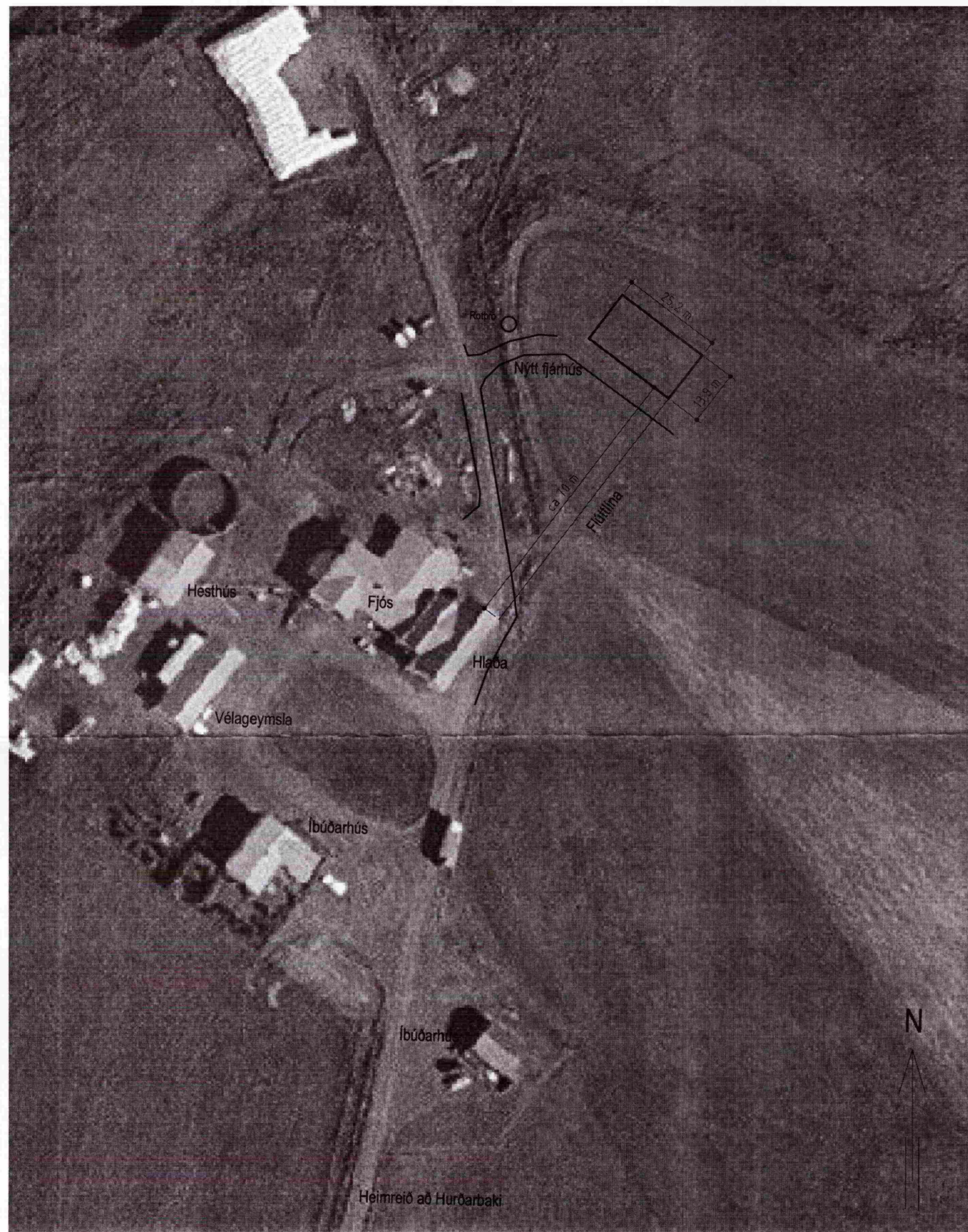
Afstöðumynd ca 1:1000

SAMÞYKKT 07 MARS 2012 Þelga Þjálmann Byggingaálittrúi uppvi. Árnæssýslu og Flóahrr.